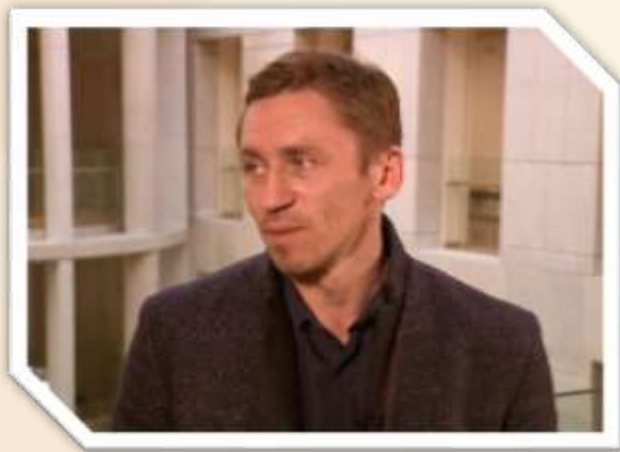
Игорь Павлович Колб Премьер Мариинского театра