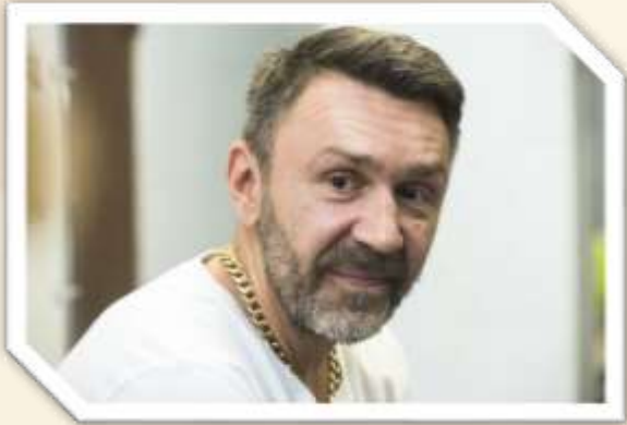
Сергей Владимирович Шнуров музыкант